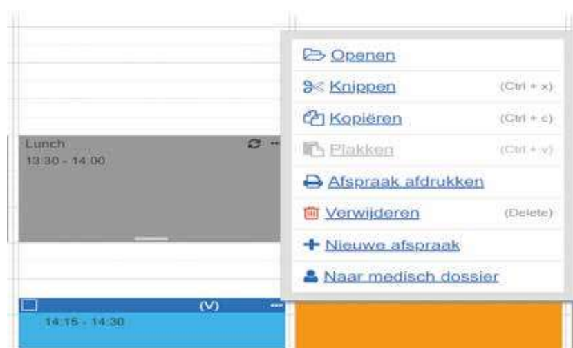
Figuur 1. Aanklikken van de drie puntjes naast de naam geeft een snelmenu met acht functies