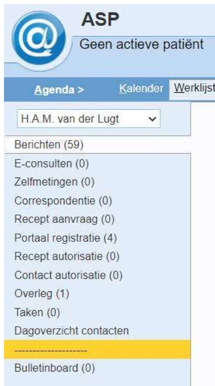
Figuur 4. De items van de werkljst met het aantal dat nog gedaan moet worden. In het tabblad spreekkamer ziet u deze items ook