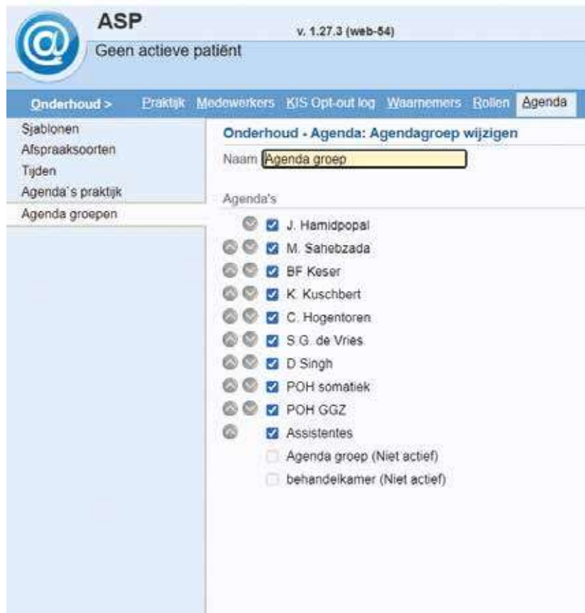
Figuur 3. Het samenstellen van de groepsagenda: in het gele vlak vult u de naam in. De blauwe vinkjes geven aan wie in de groepsagenda voorkomt. Via de grijze pijltjes bepaalt u de volgorde