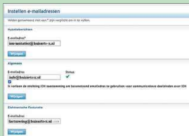
Figuur 1. Hier kunt u de juiste e-mailadressen invullen

In de ZFT-applicatie stelt u in welke mutatieberichten u betreffende de dossieroverdracht wilt ontvangen. Hier zit rechts boven een knop Praktijkinstellingen (zie figuur 2). Met name de melding Indien de ontvanger een be-