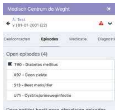
Figuur 6. Een overzicht van de episodes

mooi overzicht van de verschillende soorten diagnostiek. Er zijn drie symbolen te zien. Ze geven bijvoorbeeld labuitslagen en lichamelijk onderzoek weer (zie figuur 8). Allemaal in te zien door de regels uit te klappen. Zo missen we tijdens een visite geen informatie meer en is deze in ieder geval makkelijk terug te zoeken.