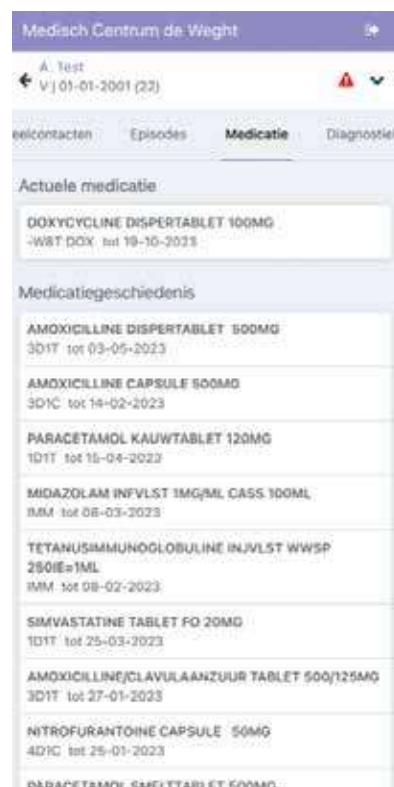
Figuur 7. De actuele medicatie

HANNEKE TAN-KONING HANNEKE.TAN@SANDAY.COM