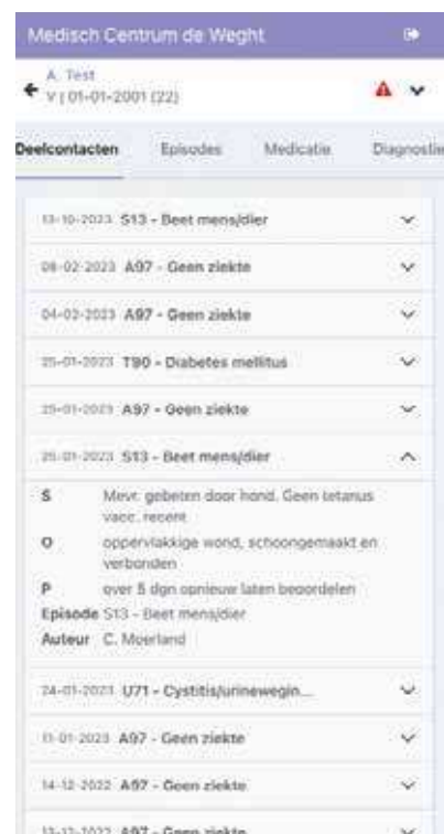
Figuur 3. Door op een deelcontact te klikken wordt de inhoud zichtbaar

deelcontact is aan te klikken om de inhoud zichtbaar te maken. In figuur 3 is het deelcontact van 25 januari 2023 geopend. De SOEP-regels zijn in te zien en ook kunt u zien wie de auteur is van het deelcontact.