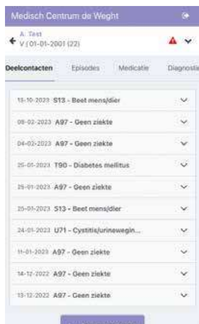
Figuur 2. Een overzicht van de deelcontacten

U ziet dan een eerste overzicht van de deelcontacten (figuur 2). Elk