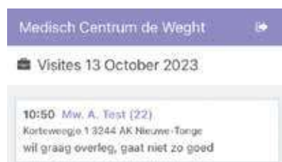
Figuur 1. De geplande visites

U kent het wel. Er staat een visite gepland in uw agenda, u kent de patiënt, kijkt naar de reden en raadpleegt het dossier. Of u kent de patiënt minder goed, draait een visitelijst uit en gaat op stap. Bij de patiënt aangekomen, mist u toch informatie. De visitelijst geeft te weinig informatie of u had het noodzakelijke toch niet goed onthouden. U kunt in ieder geval geen antwoord geven op vragen van uzelf of de patiënt. Eerder kon u het in meest gunstige geval inloggen op een meegebrachte tablet of laptop. Dit voor ons allemaal herkenbare probleem is nu opgelost met de Consult-To-Go-app van Sanday voor de huisarts. Deze app is gratis te downloaden in de Apple App store en de Google Play store. Er wordt eenmaal per dag ingelogd met naam/wachtwoord en token. De