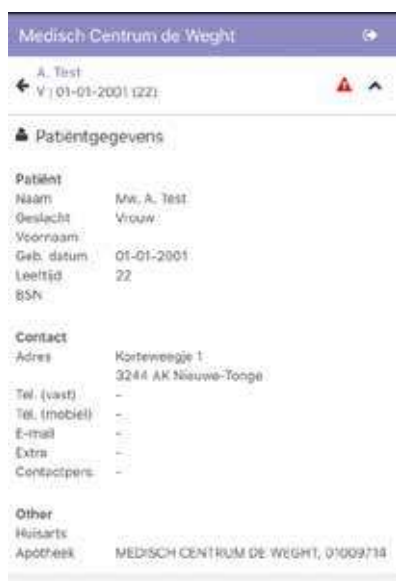
Figuur 4. De administratiegegevens van de patiënt

Rechtsboven in de app zijn de administratiegegevens van de patiënt te raadplegen (figuur 4). De rode driehoek geeft aan dat er belangrijke informatie is in het kader van contra-indicaties en overgevoeligheden (figuur 5).