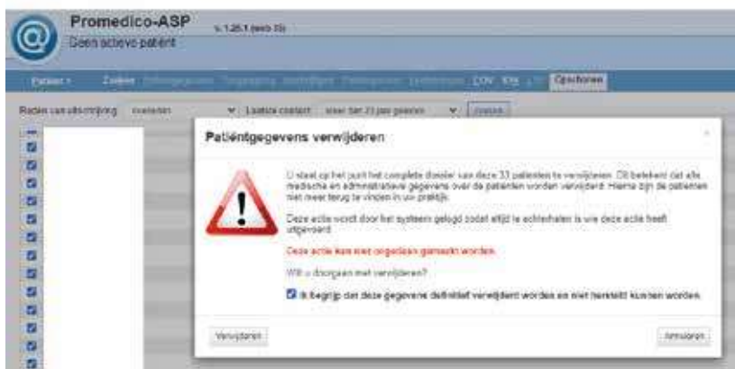
Figuur 4. U wordt gewaarschuwd dat u onherroepelijk dossiers gaat verwijderen