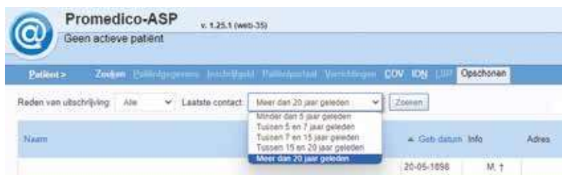
Figuur 3. U kunt dossiers selecteren op hoe lang geleden het laatste contact is geweest