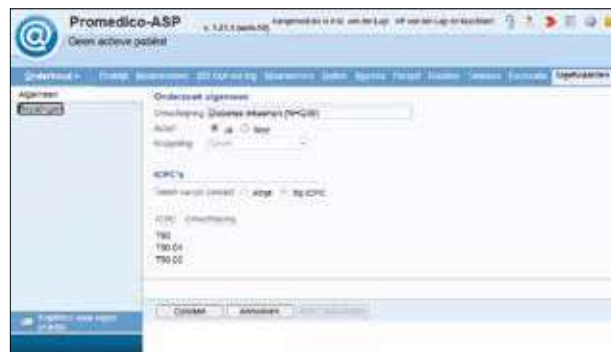
Figuur 2. De algemene instellingen van onderzoeken

Protocollaire zorg kan geleverd worden via uw HIS en via een KIS (ketenzorginformatiesysteem). Een KIS is dus niet nodig.