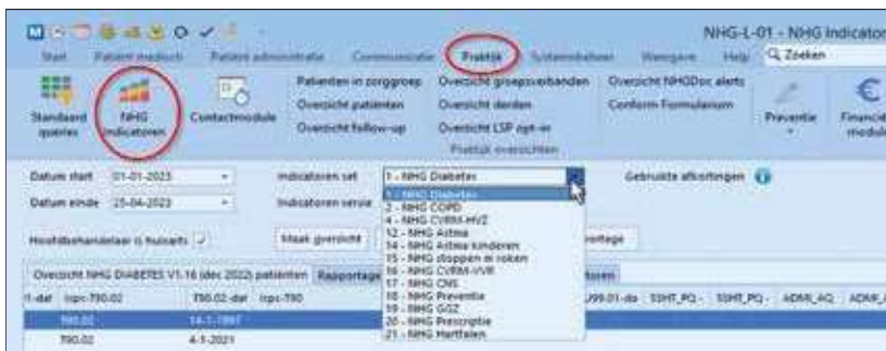
Figuur 4. De Praktijk-NHG Indicatoren

te maken. Dit is vervolgens te delen met collega's door te exporteren en te importeren. Hier voor verwijst ik naar de handleiding Nieuwe onderzoeken en formulieren maken in MicroHIS, die te vinden is in de online Help.