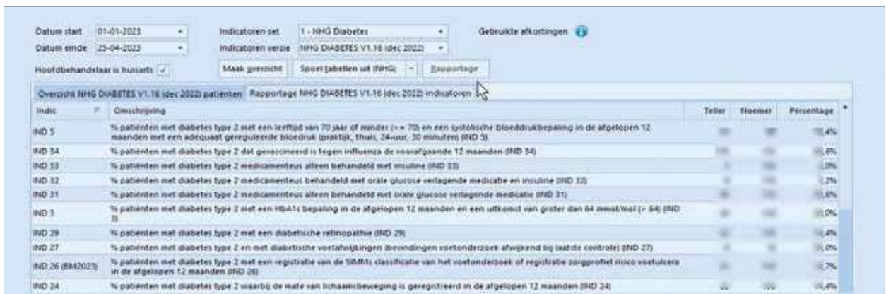
Figuur 5. Rapportage van indicatoren voor diabetes mellitus

Kijk voor meer Tips en trucs op Haweb in de groep Orego (alleen voor leden) verenigingszaken.