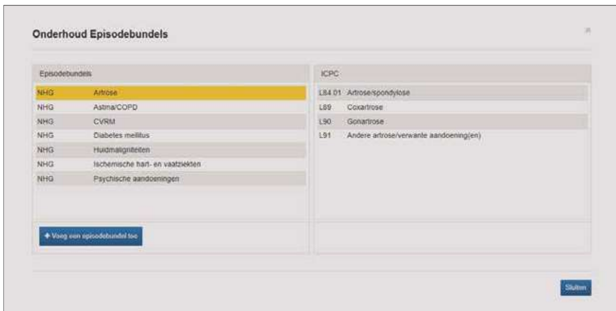
Figuur 1. De zeven episodebundels van het NHG

In deze tips en trucs gaat het over episodebundels. Episodes liggen als een aparte laag over de deelcontacten heen: ze ordenen de losse deelcontacten. De primaire ordening van het medisch dossier is in Promedico-ASP via de episodes geïntegreerd in het HIS. Eigenlijk zijn alleen de meetwaarden niet via episodes geordend en daar zijn goede redenen voor. De episodebundels zijn