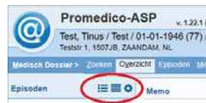
Figuur 2. Het tandwielje

De standaardbundels zijn Artrose, Astma/COPD, CVRM, Diabetes mel-