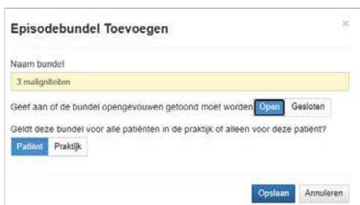
Figuur 4. Het toevoegen van een patiëntgebonden episodebundel