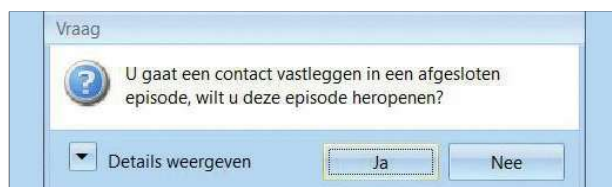
Figuur 2. De waarschuwing voor een gesloten, opnieuw te openen episode