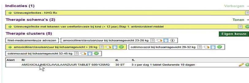
Figuur 5. Bij een kind kunt u rekening houden met het lichaamsgewicht