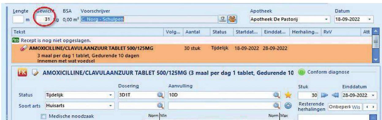
Figuur 6. Het lichaamsgewicht kunt u ook invullen in het recept

gemaakt door de huisarts of de assistente. In het eerste geval kan de assistente een overlegtaak aanmaken voor de huisarts, die vervolgens het contact kan afhandelen of na maken van het recept de taak kan Terugzetten naar de assistente. In geval de assistente het contact volledig zelfstandig afhandelt kan zij hierna een autorisatietaak aanmaken voor de huisarts. Hoe dit moet is terug te lezen in SynthesHis