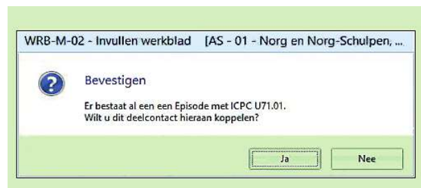
Figuur 2. U kunt al dan niet koppelen aan een bestaande episode

Afhankelijk van de werkafspraken binnen de praktijk wordt het recept