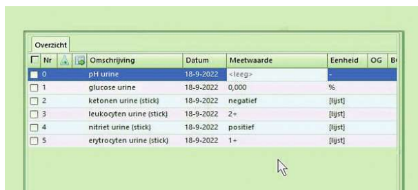
Figuur 1. Invullen van het urineonderzoek

De assistente registreert de klachten in de S-regel. Handig sedert MHX 16 is dat bij dubbelklikken in het S-veld een groter tekstvak opent voor een beter overzicht. Maak een tekstdocument (in Word of kladblok) met de standaardvragen bij een urineweginfectie. Kopieer deze tekst en plak die in het vak en vul de vragen in. Ook is het gebruik van automatische tekst met behulp van een programma als Autohotkey of Texter een optie. Hierover zijn enkele items op Haweb in de groep e-Health te vinden.