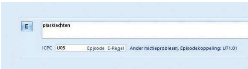
Figuur 3. Het toevoegen van een E-regel