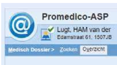
Figuur 1. De aanduiding dat een patiënt aangemeld is bij het patiëntenportaal

Er is nu er een klein jaar ervaring met OPEN. Patiënten stellen ons er allerlei vragen over. Hoe is dat op te lossen? De toegang tot OPEN gaat nu alleen via het patiëntenportaal en nog niet via een PGO. Het PGO wordt momenteel uitgerold en dan wordt het nog ingewikkelder. Het