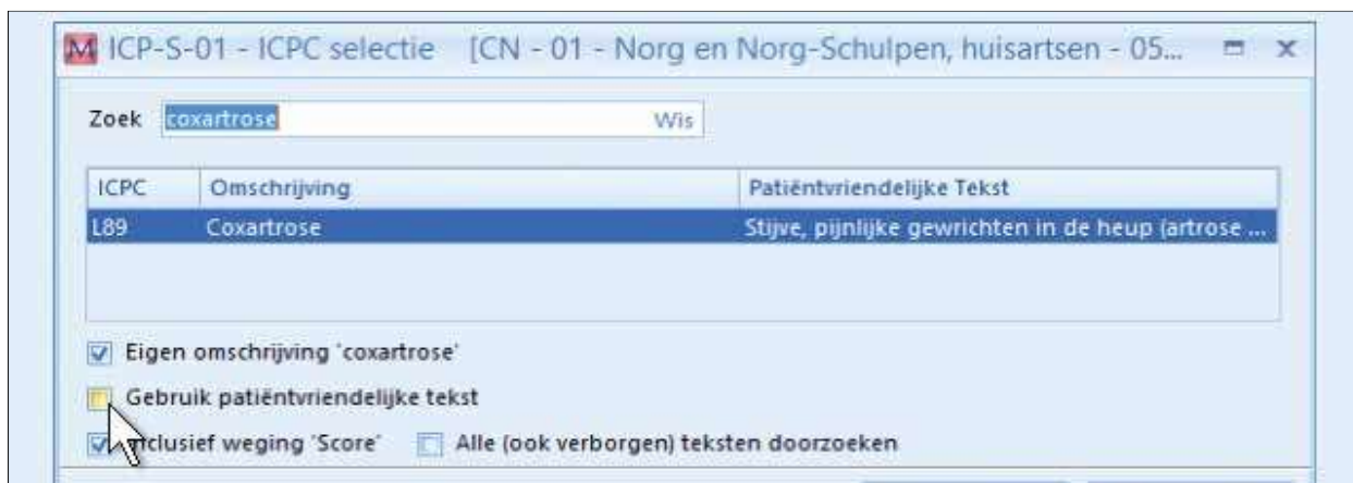
Figuur 3. Het aanpassen van de episodetitel