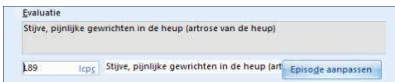
Figuur 4. De diagnose 'coxartrose' is in de E-regel in eenvoudige taal omschreven.

ent ziet dan thuis deze tekst in het PLAN staan. Ook kunt u hier een koppeling naar een pagina van Thuisarts.nl plakken. Dit is helaas nog niet geautomatiseerd.