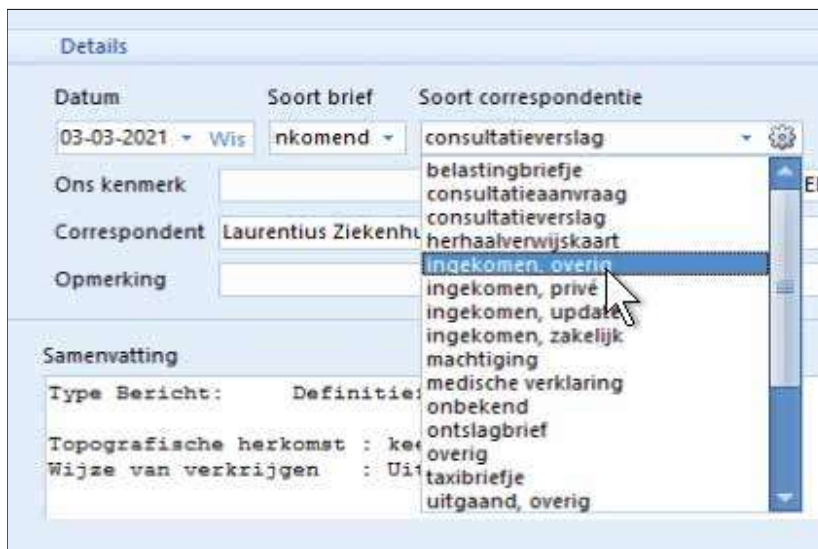
Figuur 1. Correspondentie aan een code koppelen

correspondentie aan een andere code ('soort correspondentie', zie figuur 1), bijvoorbeeld 'ingekomen, overig'.