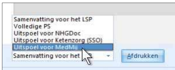
Figuur 2. Klik op Uitspoel voor MedMij en u ziet wat de patiënt in het portaal of in het PGO kan zien.