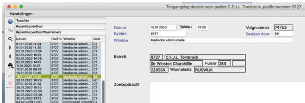
Figuur 2. In de overzichtslijst, het linker deel van het venster, wordt in vier kolommen getoond wie op welke datum op een specifieke tijd gegevens van een specifieke patiënt heeft ingezien. Een dossier hoeft niet te worden bewerkt om de gegevens te loggen. Deze rapportage wordt ook wel het 'snuffelverslag' genoemd. In de overzichtslijst kan een langere of kortere periode (laatste veertien dagen) worden getoond. Daarnaast kunt u een apart overzicht maken van de inzage door waarnemers.

In dit venster kunnen twee typen overzichten worden gemaakt, algemene en gespecificeerde. Met de overzichtslijst kan de gehele log, een recente reeks (veertien dagen) of een reeks van waarnemers worden getoond. In deze lijsten kunt u de gewenste informatie zoeken door in de verschillende kolommen te sorteren, handmatig en op het oog. In het eigenlijke venster, het vensterdeel rechts van de overzichtslijst, kunt u meer gericht specifieke informatie zoeken met behulp van zoekvelden, zoals de gegevens van een patiënt, van een medewerker of gegevens op een specifieke datum.