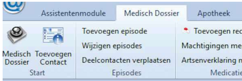
Figuur 3. Het bewerken van episodes kan onder het tabblad Medisch Dossier