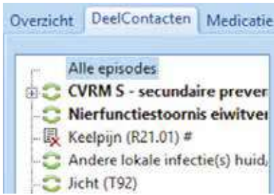
Figuur 2. Het overzicht van de episodes