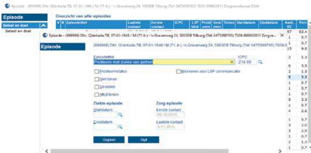
Figuur 2. Een vinkje in het vakje 'Blokkeren voor LSP communicatie' blokkeert de hele episode.