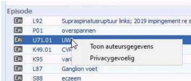
Figuur 2. Kies Privacygevoelig met de rechter muisknop.