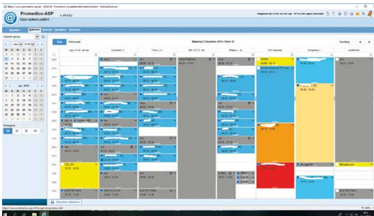
Figuur 1. Een geanoniseerd overzicht van de kalender met alle medewerkers

Doordat Promedico-ASP geheel via internet communiceert was een aantal handige kalenderfuncties eerder niet makkelijk in te bouwen. Inmiddels lukt dat wel. Gedurende de dag loopt er een rode horizontale tijdlijn mee over de kalender en hoeft u als assistente niet op de klok te kijken om te zien waar u in de kalender bent.