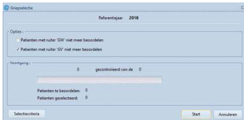
Figuur 3. Het toevoegen van het nieuwe jaar 2018