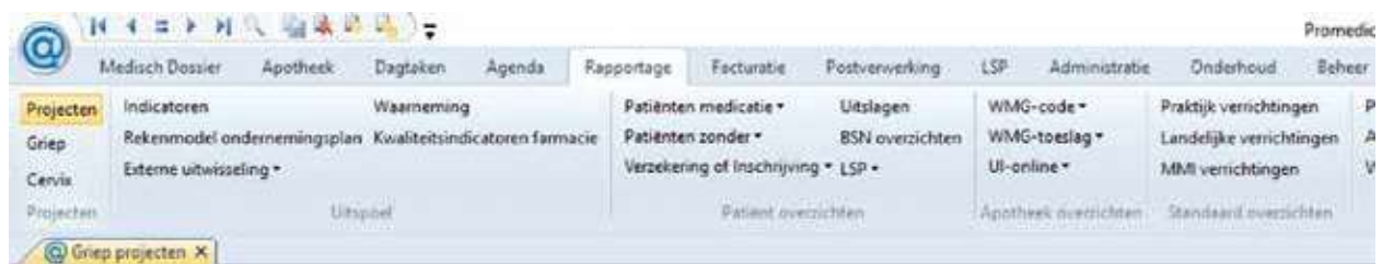
Figuur 1. Het starten van een griepproject via Rapportage

Door op de i te klikken kunt u de reden van de selectie zien. Met de rechter muisknop kunt u naar het