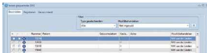
Figuur 6. Het beoordelen van de nieuwe mogelijk geïndiceerden

WILLEM VAN DER LINDEN WILLEM@HUISARTSPRAKTIJKDELINDE.NL