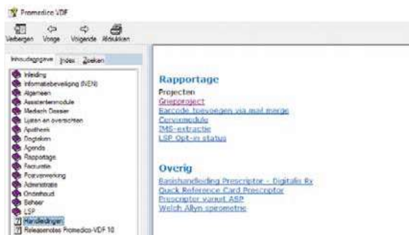
Figuur 7. De Handleiding Griepproject