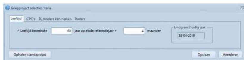
Figuur 4. De selectiecriteria