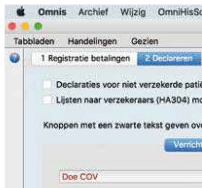
Figuur 1. De taakknop Help

taak de helptekst door een trefwoord te bedenken en OmniHis-Scipio te laten zoeken op een toe-