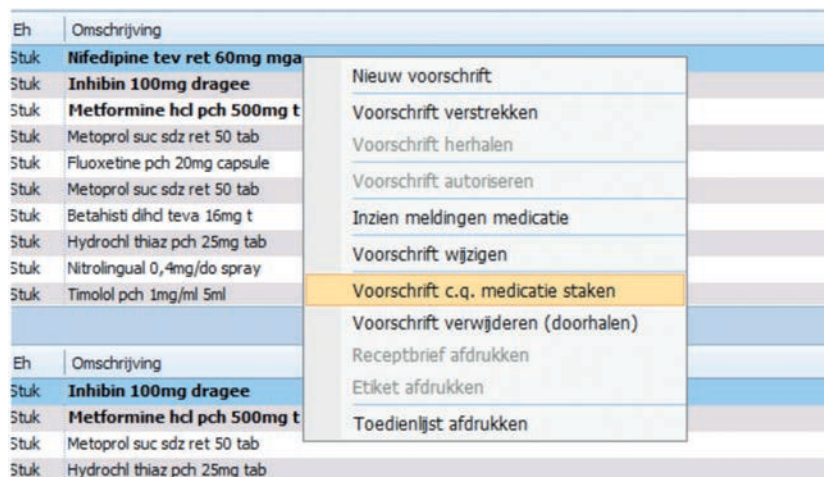
Figuur 1. Pop-upschermscherm: hydrochloorthiazide staken

Wanneer u de betreffende regel aanklikt, kunt u de reden voor het stoppen aangeven (zie figuur 2). Zo nodig kunt u bij elke reden een toelichting geven. Bij de keuze 'Anders' is dit verplicht, bij de rest is het facultatief. Een wijziging in de medicatie ondersteunt Promedico-VDF ook. De einddatum van het gewijzigde voorschrift wordt opnieuw berekend.