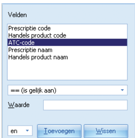
Figuur 3. Let erop dat u de regel ATC-code selecteert