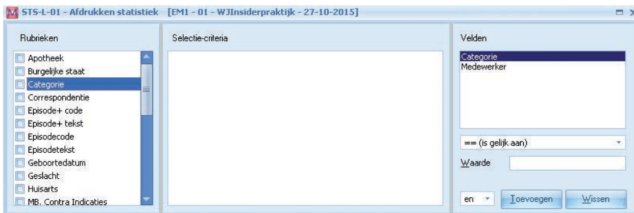
Figuur 2. De keuze 'Categorie'