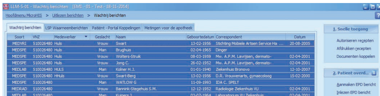
Figuur 1. Alle binnengekomen elektronische post geselecteerd en op huisarts gesorteerd